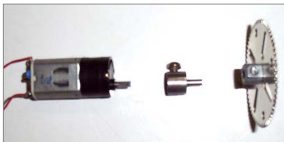
21: Shembull – koncepti i një njësie mësimore